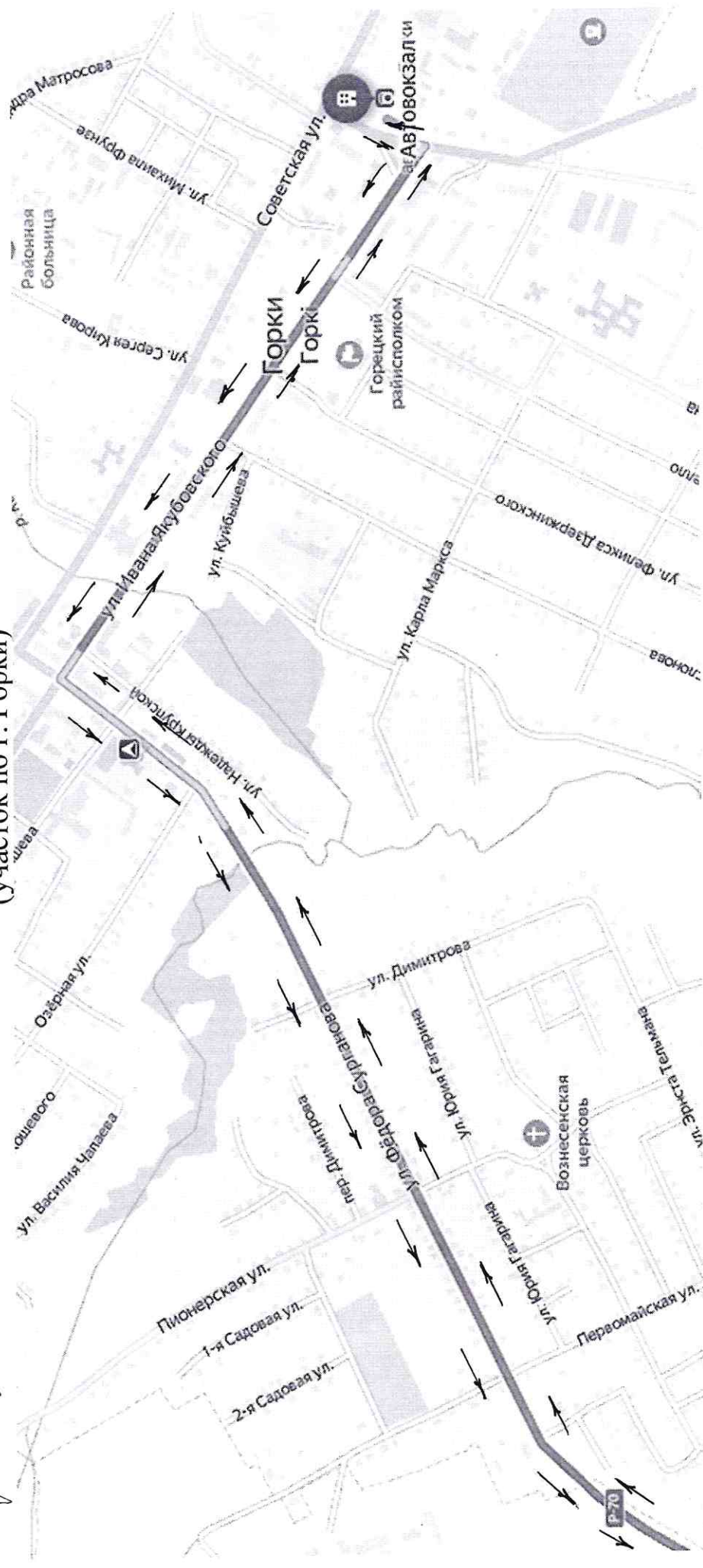
Схема междугородного маршрута № 6304-ТК «Горки – Гомель» (участок по г. Горки)

26.09.2023 №1 Решение комиссии конкурсов по №6304-ТК от 20.09.2023